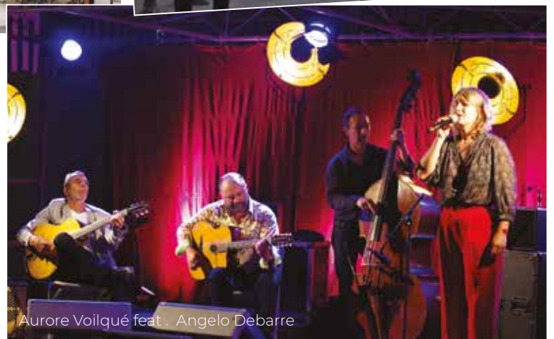
Aurore Voilqué feat. Angelo Debarre