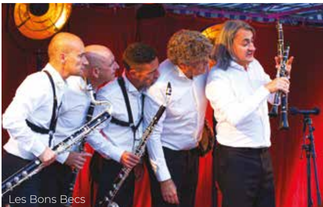
Les Bons Becs