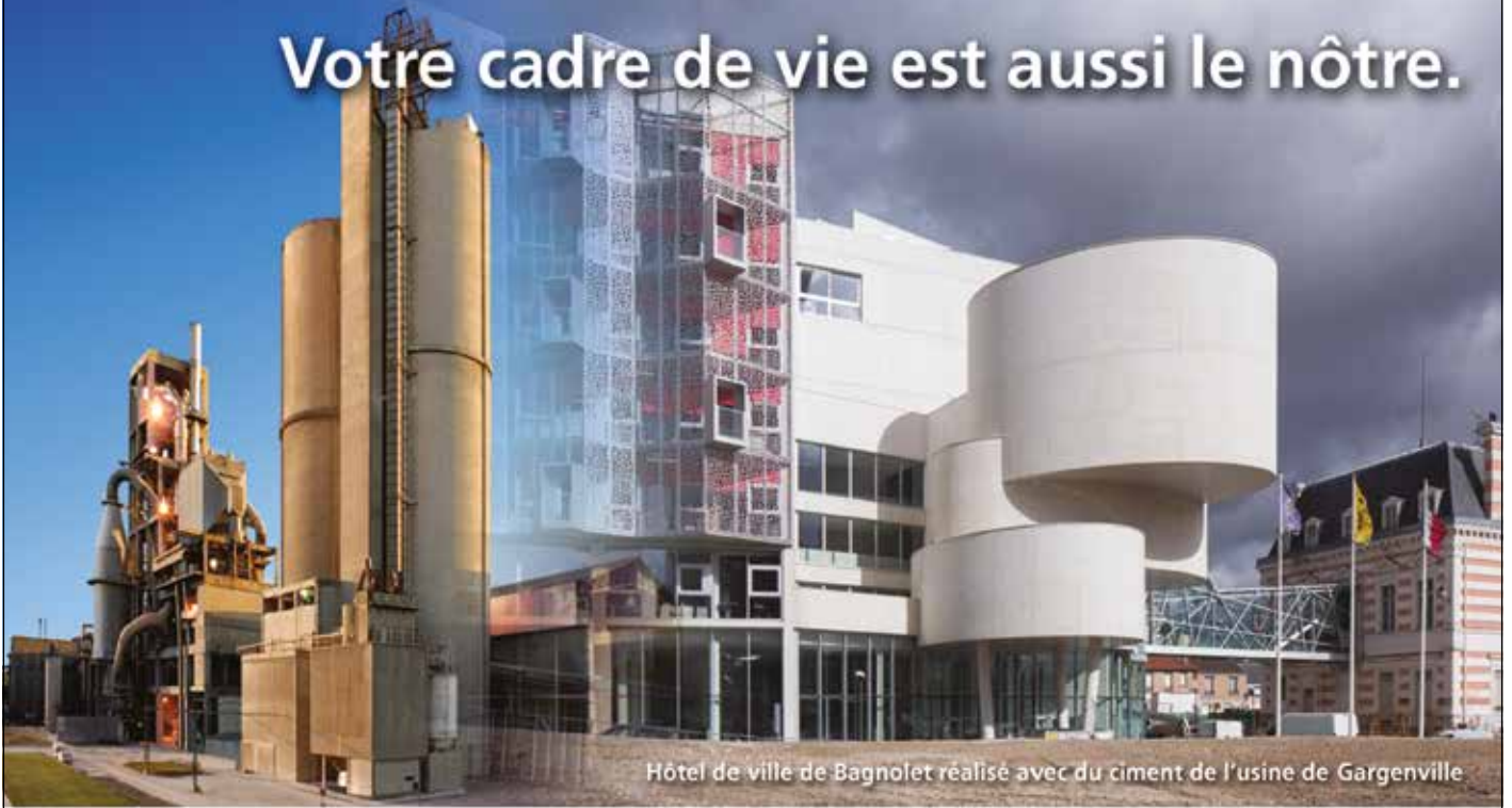
Hôtel de ville de Bagnolet réalisé avec du ciment de l'usine de Gargenville