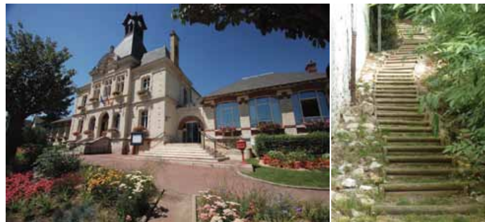
Mairie de Juziers / Une sente dans Juziers