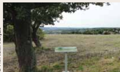
Panorama depuis la table de lecture