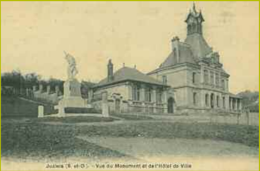
Juziers (E. et O.) - Vue du Monument et de l'Hôtel de Ville